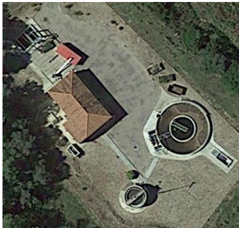
EDAR PINELL DE BRAI