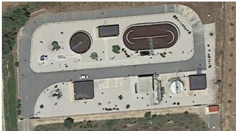
EDAR HORTA DE SANT JOAN